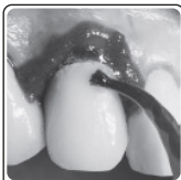
Fig.1 – Dispense cuidadosamente uma camada homogênea de condicionador ácido na porcelana preparada.

A porcelana deverá ter um aspecto fosco. Se isto não for obtido, o condicionamento deve ser repetido.