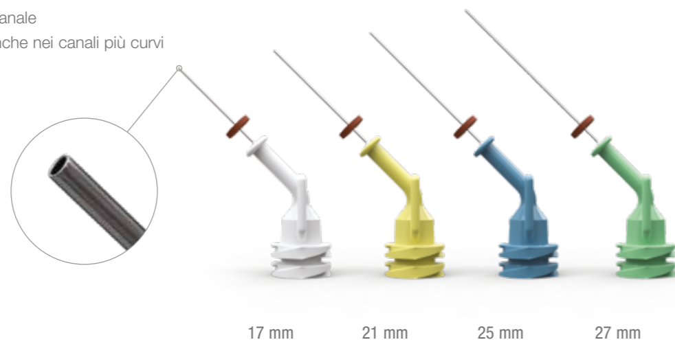
17 mm 21 mm 25 mm 27 mm