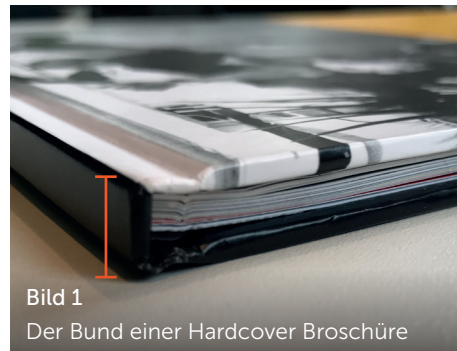
Bild 1 Der Bund einer Hardcover Broschüre

Unten sehen Sie ein Beispiel von einem 24 Seitigem A4 Einband, ausgebreitet als spread.