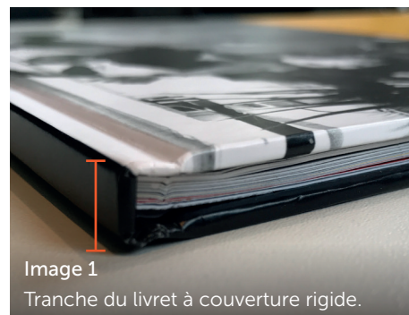
Image 1 Tranche du livret à couverture rigide.

Veuillez télécharger votre visuel sur un seul PDF de façon que l'arrière de la tranche et l'avant de la couverture soient côte à côte.