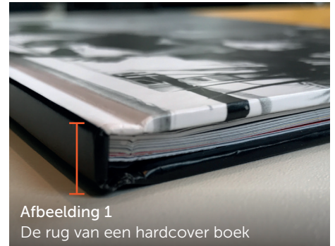
Afbeelding 1 De rug van een hardcover boek

Houd onderstaande rugdiktes aan voor de betreffende papiersoorten en aantal binnenwerkpagina's.