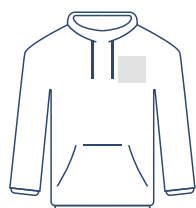
Borst Links 100 x 100 mm

Gebruik de grootte van je gekozen print positie als de basis (qua maat) voor je ontwerp en benoem het naar deze positie (bijvoorbeeld: borst.pdf):