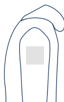
Linker Schouder 100 x 100 mm