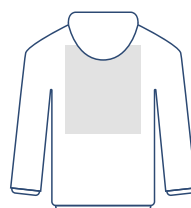
Rug Groot 300 x 350 mm