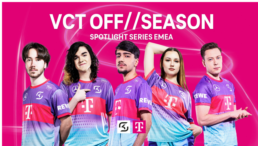
SK Gaming Roser für VCT OFF//SEASON

Die Deutsche Telekom treibt mit ihrer Equal eSports Initiative die Einführung von Mixed-Teams in offiziellen Turnieren weiter voran. Dabei geht der Partner SK Gaming mit gutem Beispiel voran und nimmt dieses Jahr an zwei wegweisenden Turnierserien teil. Beim League of Legends PRM Cup 2024 tritt das Frauen-Team SK Avarosa in einem Wettbewerb an, der bisher von Männer-Teams dominiert wurde. Gleichzeitig stellt SK Gaming ein Mixed-Team für die Valorant VCT OFF//SEASON Spotlight Series . In beiden Teams treten Spielerinnen an, die durch die Equal eSports Initiative gefördert werden. Mixed-Teams gelten als Zukunft des eSports, und die Initiative verfolgt seit jeher das Ziel, diese als festen Bestandteil im kompetitiven Gaming zu etablieren. Nun zeigt sich, dass sich in der Szene etwas bewegt, und es ist deutlich zu sehen, dass das Engagement der Initiative zu positiven Veränderungen beigetragen hat. Diese neuen Entwicklungen beweisen, dass Vielfalt und Chancengleichheit im eSports nicht nur möglich, sondern erreichbar sind.