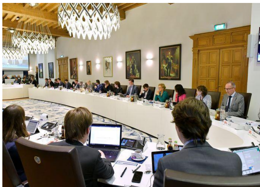
De raadszaal van de gemeente Delft