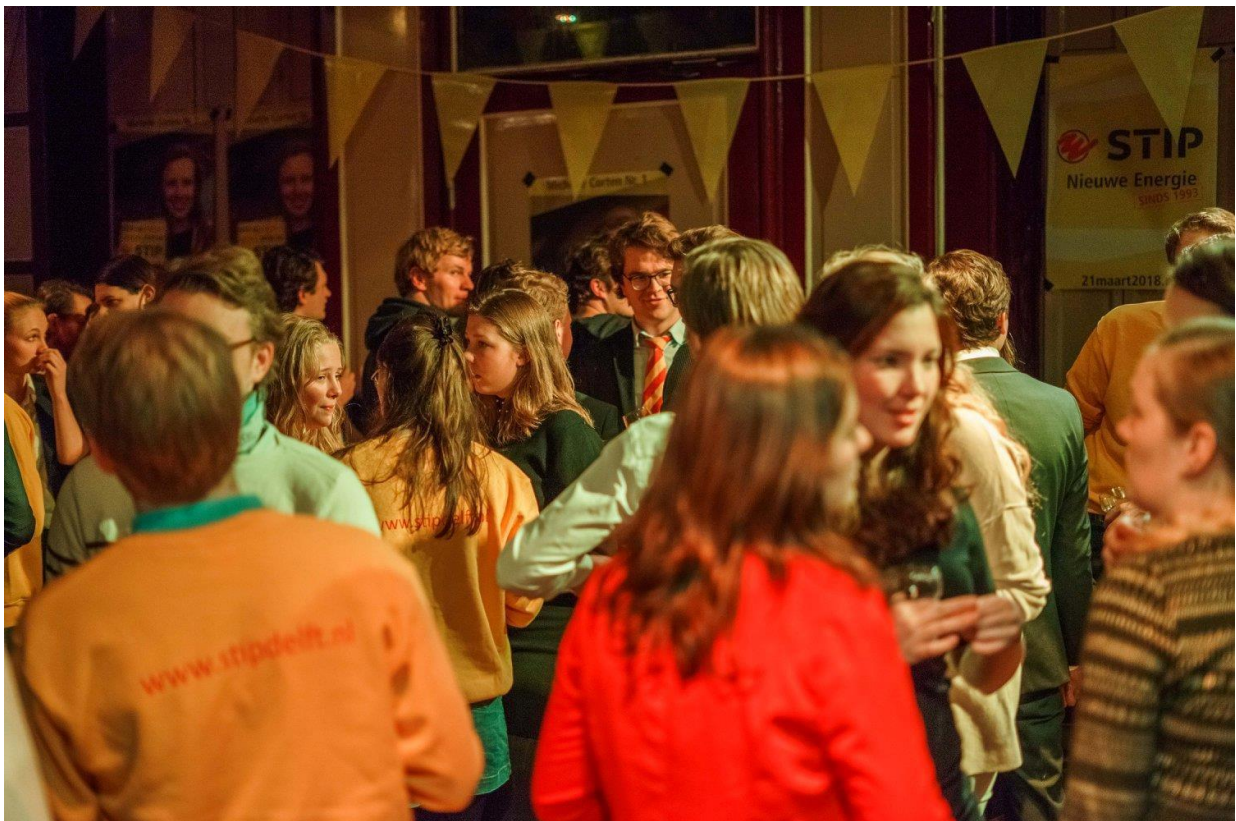
STIP'ers op een borrel op een studentenvereniging

Het campagnebestuur duurt een jaar en is grotendeels part time. Gemiddeld kosten de bestuursfuncties tussen de 10 en 14 uur per week. Het is daarmee goed mogelijk om je studie met het bestuur te combineren. Gedurende de campagne, 6 weken voor de verkiezingscampagne, zit het bestuur full time. Zo kan er volop aan de campagne worden gewerkt. De bestuurstaken vinden overwegend overdag plaats, behalve tijdens de full time periode waar ook in de avonden campagne gevoerd zal worden. Ook zullen veel van de leuke activiteiten in de avonden plaats vinden, zoals dinertjes met andere besturen.