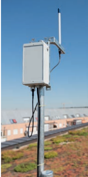
LoRaWAN®-Gateway – für das Netz der Zukunft.

Im Netzgebiet der Netze BW führen wir diese Technologie ein. Auch Ihre Kommune kann davon profitieren und das LoRaWAN®-Netz der Netze BW Sparte Dienstleistungen mitnutzen. Sprechen Sie uns an.