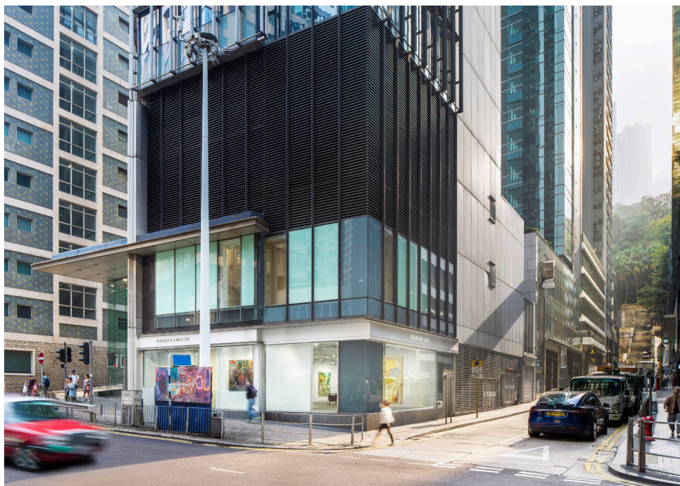
豪瑟沃斯香港外景，中環皇后大道中8號

豪瑟沃斯香港中環的臨街新址於2024年1月24日開幕，首展呈現中國藝術家張恩利個展「臉」。畫廊新空間坐落於香港中環皇后大道中8號，位於歷史悠久的雪廠街、都爹利街及皇后大道中交界，由塞爾多夫建築事務所 (Selldorf Architects) 主導設計。