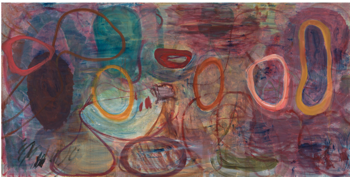
張恩利，《遠方的客人》，2023年