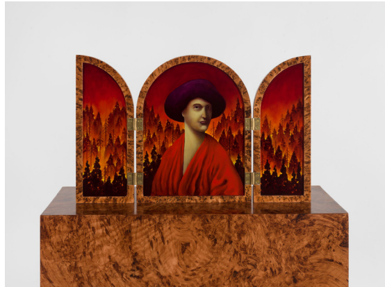
尼古拉斯·帕蒂，《紅色森林三聯畫》，2023

豪瑟沃斯回歸弗里茲首爾藝博會，聚焦畫廊頂尖藝術家的傑出創作，其中多位於今年舉辦重要美術館及機構展覽。