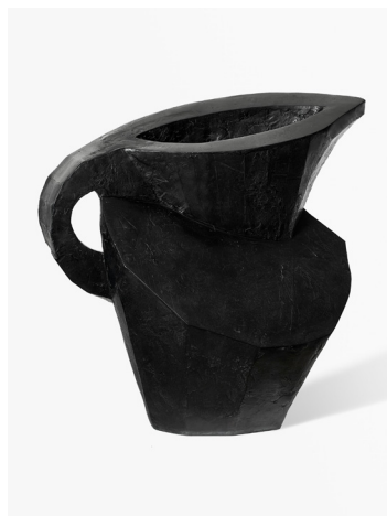
William Kentridge, 'Fill,' 2017