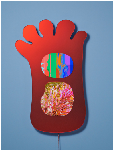
Pipilotti Rist, 'Marmelade Playhouse' (detail), 2024