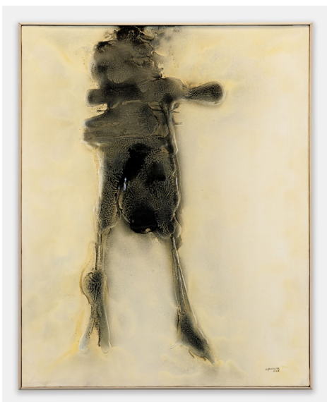
Carol Rama, 'Ohne Titel (Untitled),' 1968