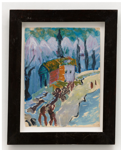
Marianne von Werefkin, Holzabfuhr in den Tessiner Bergen (Wood hauling in the Ticino Mountains), 1925-1929