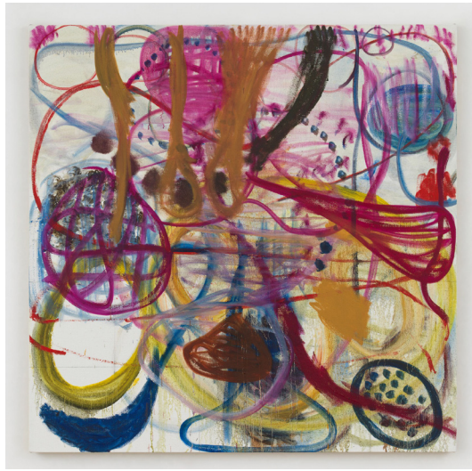
Zhang Enli, 'A Man with Bare Shoulders,' 2024

venir au Kunstmuseum Ravensburg. Également, le récipient en bronze « Fill » (2017) de William Kentridge , qui accompagnera ses futures expositions au Staatliche Kunstsammlungen Dresden et au Museum Folkwang en Allemagne, prévues plus tard dans l'année.