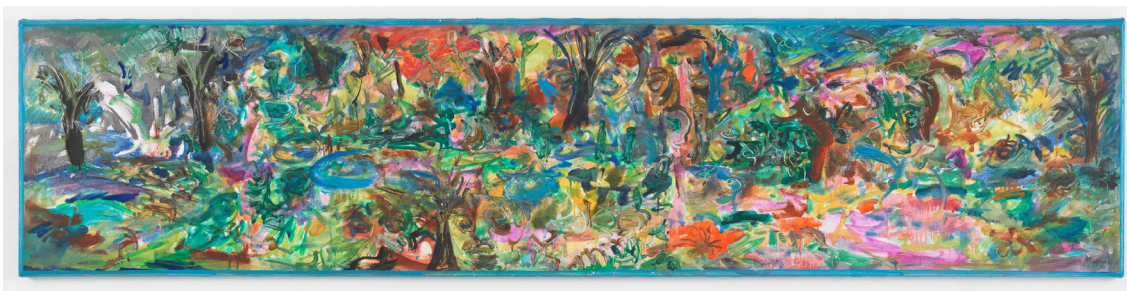
Jack Whitten, 'World's Longest Garden (Shalimar),' 1968

Le stand exceptionnel de Hauser & Wirth à Art Genève mettra en valeur le riche programme de la galerie et même au-delà, tout en célébrant les prochaines expositions institutionnelles de notre famille hétéroclite d'artistes. À travers une sélection de peintures, sculptures, œuvres sur papier et bien d'autres créations, nous mettons à l'honneur des figures incontournables de l'art moderne et contemporain.