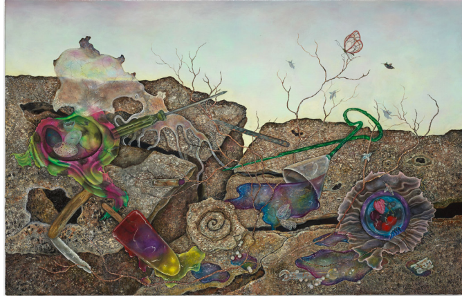
Anj Smith, 'Artist's Tools II', 2023