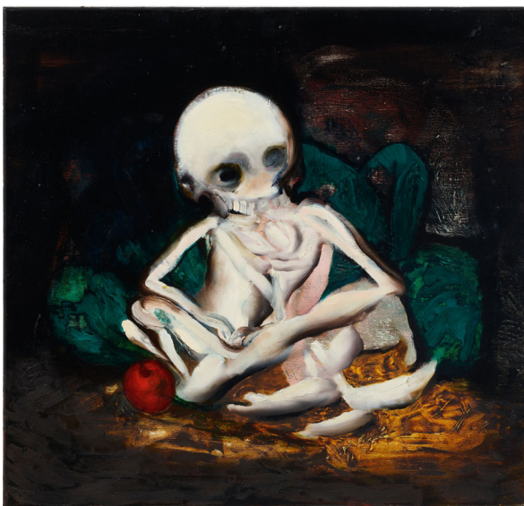
Ambera Wellmann, 'Skellein', 2024