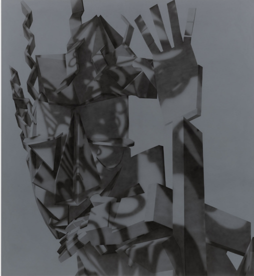
Avery Singer, 'Free Fall', 2024