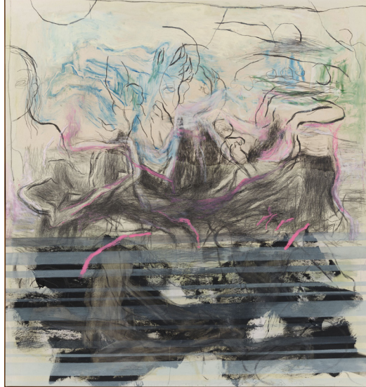
Rita Ackermann, 'Transparent Shutters', 2024

또한 이번 프리즈 서울에서는 2024년 주요 미술관 및 기관 프로젝트를 진행하는 작가들의 작품도 포함되어 있습니다. 한국의 호암 미술관에서 개인전을 진행하는 니콜라스 파티, 광주 비엔날레 본전시에 참여하는 앰브라 웰먼, 그리고 독일 베를린의 함부르거 반호프 현대 미술관에서 개인전을 진행중인 마크 브래드 포드에 작품들이 포함되어 있습니다.