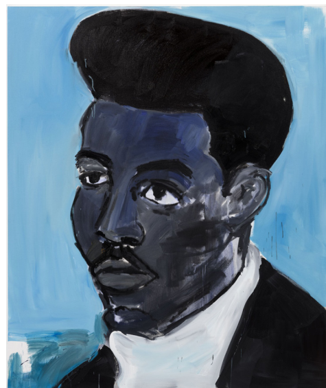
Henry Taylor, 'Blue Period', 2023