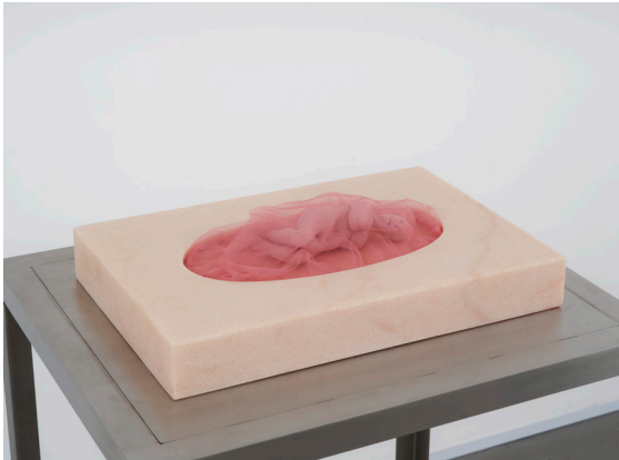
Louise Bourgeois, 'Femme', 2003