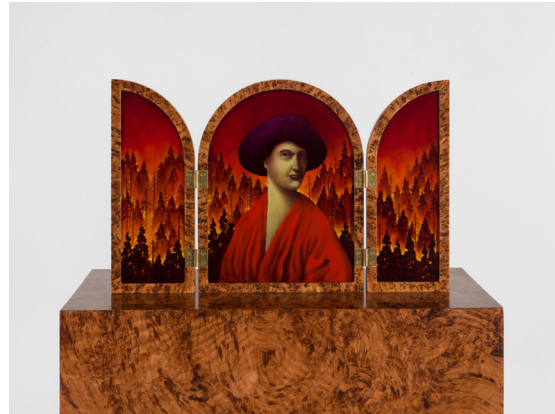
Nicolas Party, 'Triptych with Red Forest', 2023

하우저앤워스는 제3회 프리즈 서울2024에 참가하여, 올해 주요 미술관 및 기관 프로젝트를 진행하는 저명한 작가들의 작품에 초점을 맞춘 부스 프레젠테이션을 선보일 예정입니다.