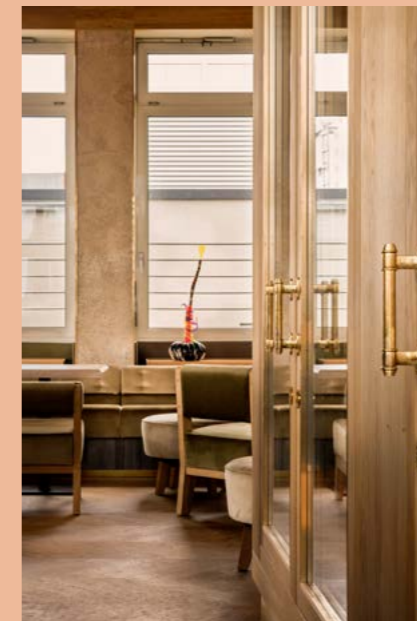
LOUNGE & BAR