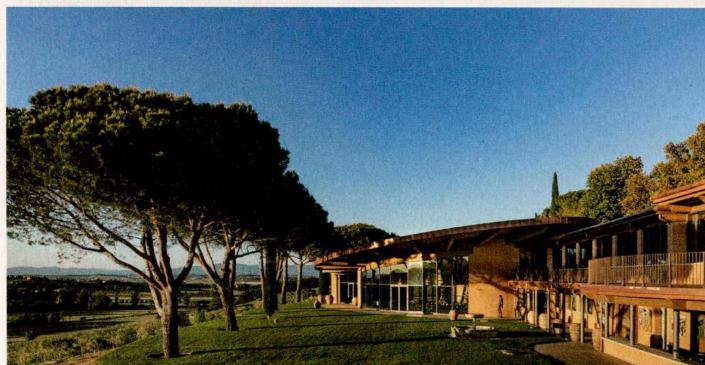
Tiefe Verbundenheit mit der Landschaft: Weingut Vallocaia mit Besucherzentrum.