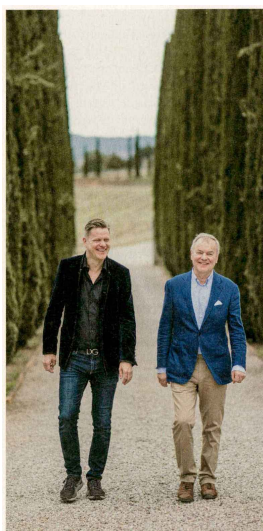
«La vita è bella»: Vater und Sohn Bindella.

«Der Weinbau ist der Schlüssel zum Verständnis des Themas Wein.»