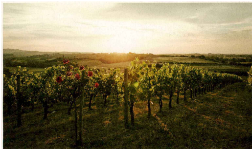
«Wie die Mohnblume»: Reben auf der Tenuta Vallocaia.

Auftrag: 1094406 Themen-Nr.: 721024 Referenz: 6842bd25-900e-46f5-87f9-da256ecd9413 Ausschnitt Seite: 3/4