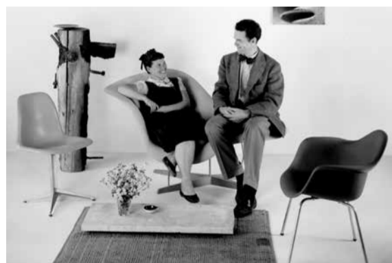
Makarna Charles och Ray Eames ligger bakom några av våra mest ikoniska designklassiker.

Charles och Ray Eames förändrade möbelindustrin i grunden med sina Shell Chairs. Den första prototypen skapades av formpressad plywood, ett beprövat material av limmade faner som gav sittmöblerna en behaglig svikt och stabilitet. Dessutom till en rimlig kostnad för en tänkt konsument, något som paret Eames värderade högt.