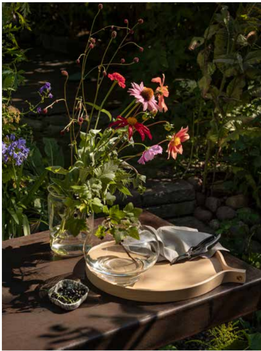
Den lummiga trädgården är en perfekt plats för umgänge med vänner och bekanta över en fika eller somrig lunch.