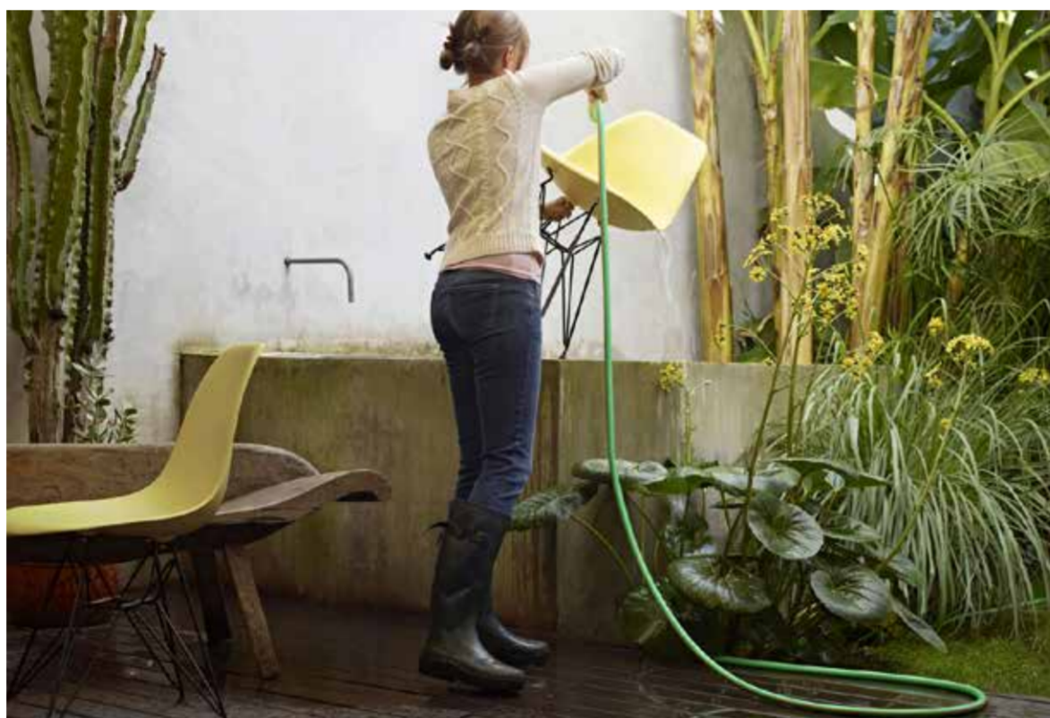
Vitras klassiska Shell Chairs, designade av paret Eames, kan användas i både ute- och inomhusmiljö.

Den återvunna plasten härstammar från insamlade av plastförpackningar från tyska hushåll, i insamlingsprogrammet "Gula påsen", och är av premiumkvalitet. Att använda återvunnet råmaterial istället för petroleumbaserad primärplast innebär att de klimatskadliga utsläppen minskas rejält, precis som primärenergiförbrukningen. Skalet är naturligtvis återvinningsbart i slutet av sin produktivslängd.