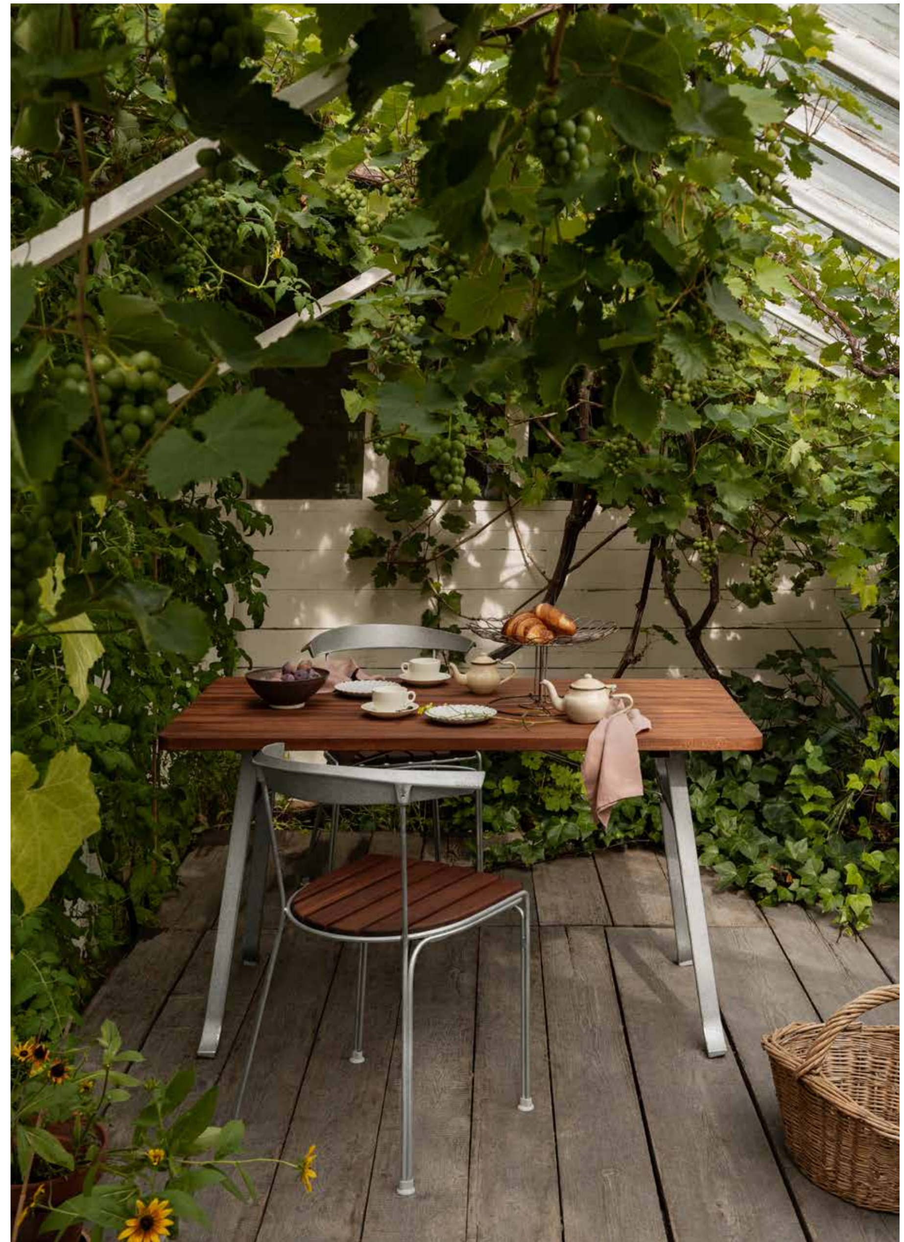
BORD Serif, Byarums Bruk. STOL Dover, Byarums Bruk.