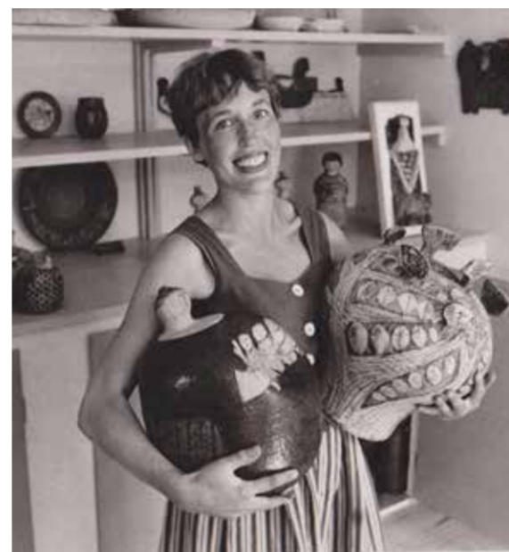
Lisa Larson, en av våra mest älskade och internationellt erkända keramikere.

I vår lanserar Design House Stockholm en kulturskatt som legat gömd i Lisa Larsons studio – en serie träfåglar i bjärta färger som den hyllade keramikern formgav 1967. Larson befann sig då i Kalifornien för att studera keramik på Berkeley. De starka färgerna och djärva mönstren som var på mode under den rådande flower-power-eran blev en stor inspiration. "Jag var sugen på att arbeta, och att måla dessa träformer var bara naturligt eftersom jag inte hade någon möjlighet att arbeta med keramik i vårt hus på den tiden", säger Lisa Larson. "Jag hade ingen aning om hur de skulle kunna rekonstrueras eller produceras när de väl var tillbaka i Sverige, men jag blev så inspirerad av allt jag såg."