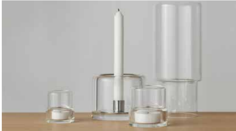
Kollektionen Tou, designad av Claesson Koivisto Rune, är inspirerad av den klassiska stormlyktan.