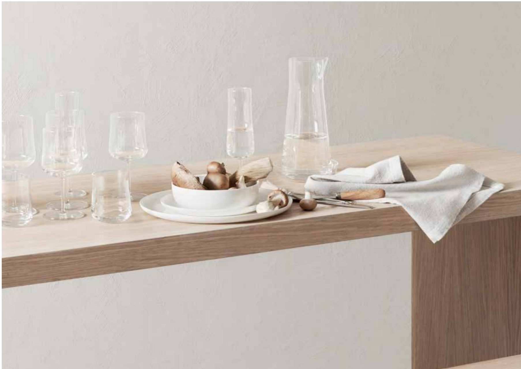
Björn Dahlström har skapat serien Informal som består av tre vinglas, ett allglas och en karaff.

Det är många spännande produkter på gång och även en del oväntade samarbeten som kommer att lyfta Orrefors till nya höjder. Konsumenterna kommer också möta en pånyttfödd tonalitet och ett bildspråk som kommer att göra det väldigt tydligt att Orrefors är att räkna med i framtiden.