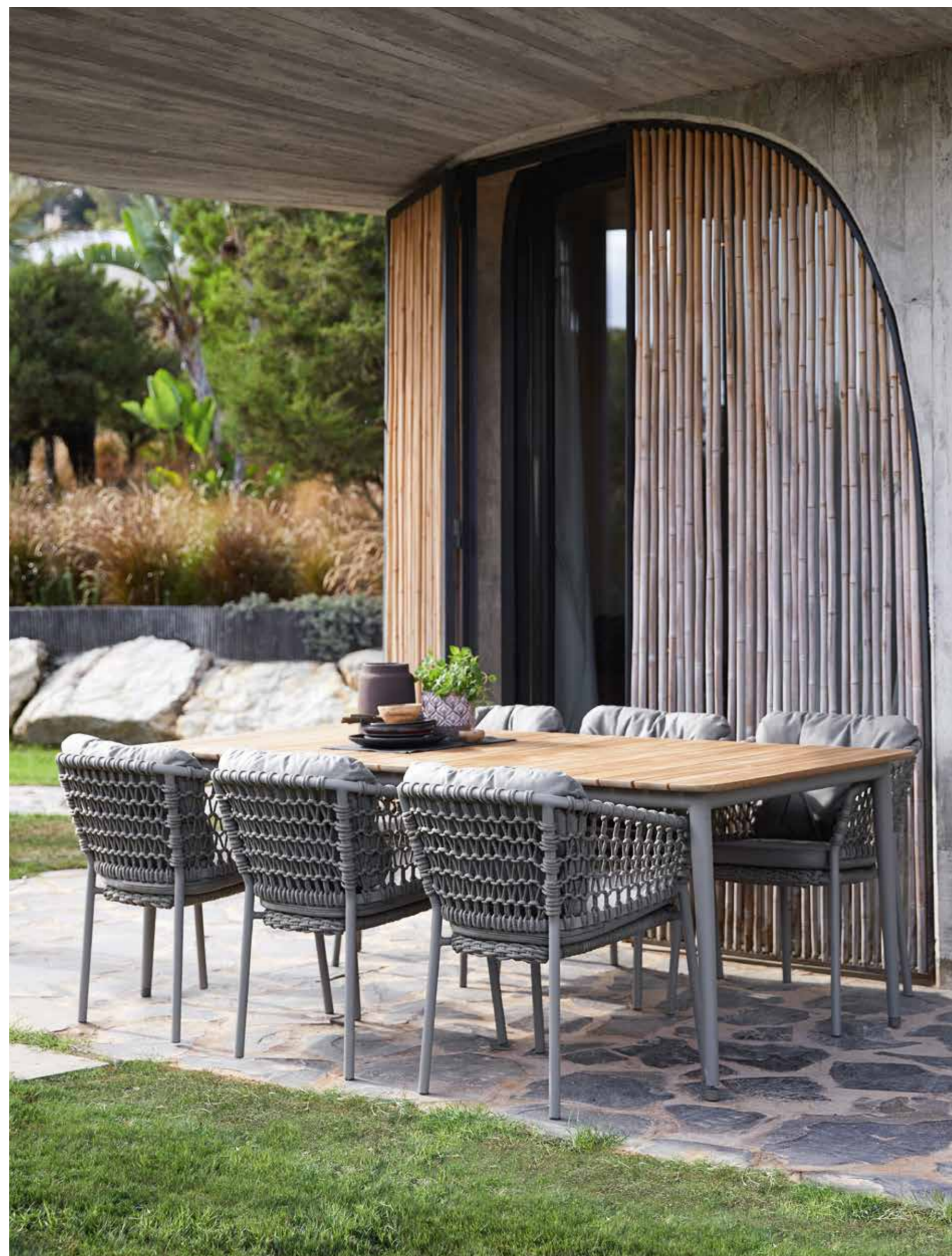
OCEAN Design by Cane-line Design