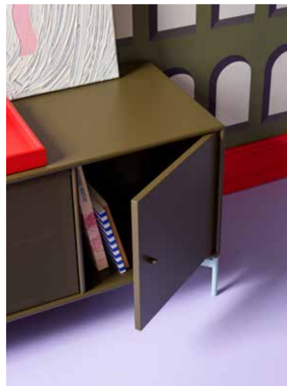
Montanas nya möbelserie för TV och ljudsystem.

Nu liksom då står Montana för ett personligt uttryck, och erbjuder oändliga möjligheter att skapa unika hem genom smart design och utmärkt hantverk. Utöver sina egna designs har de genom åren också samarbetat med designers som den nämnde Verner Panton, men även