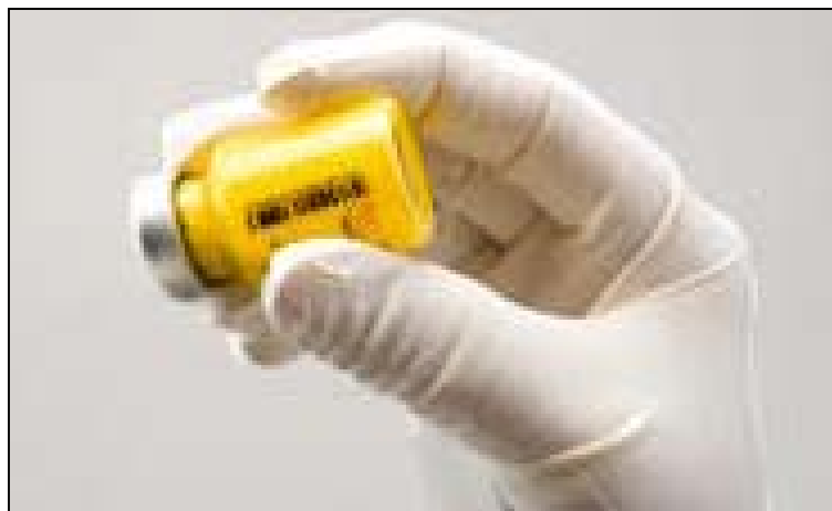
Obrázok C: Dôkladne pretrepte injekčnú liekovku

Ak sa tvorí pena, nechajte injekčnú liekovku postáť, aby sa pena stratila. Ak sa liek nepoužije okamžite, treba ho dôkladne pretrepať, aby opäť vznikla suspenzia.