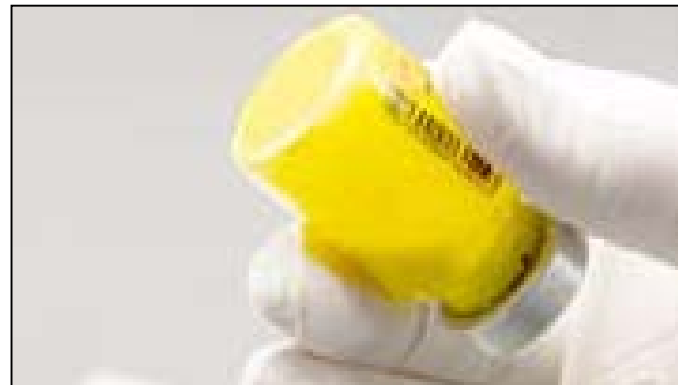
Suspendované: bez zhlukov

Obrázok B: Skontrolujte, či v liekovke neostal nesuspendovaný prášok a ak je to potrebné, opätovne poklepte