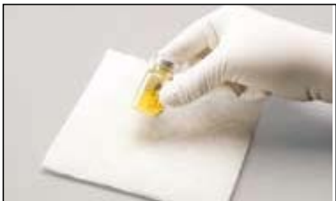
Obrázok A: Dôrazne poklepte, aby sa obsah zmiešal