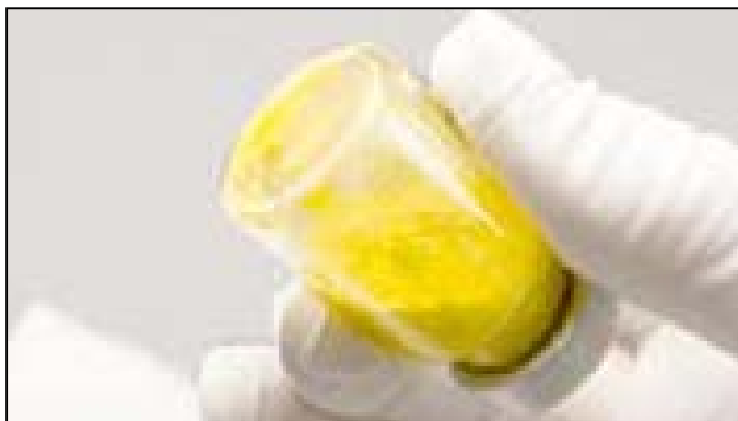
Nesuspendované: viditeľné zhluky