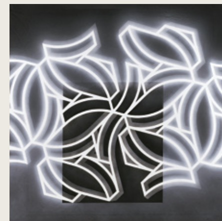
Claroscuro, 1997. Acrílico sobre tela, 200 x 200 cm.