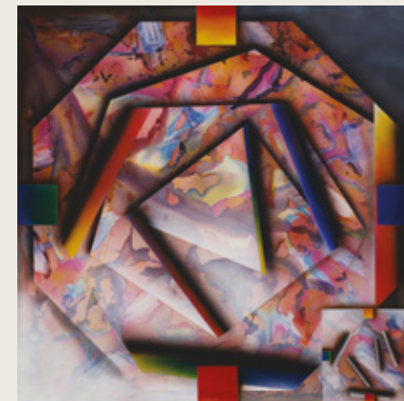
Premonición, 1989. Acrílico sobre tela, 200 x 200 cm.

La exhibición podrá visitarse entre el 23 de junio y el 9 de septiembre de 2016 en Casa Naranja de lunes a viernes 9 a 19 hs.