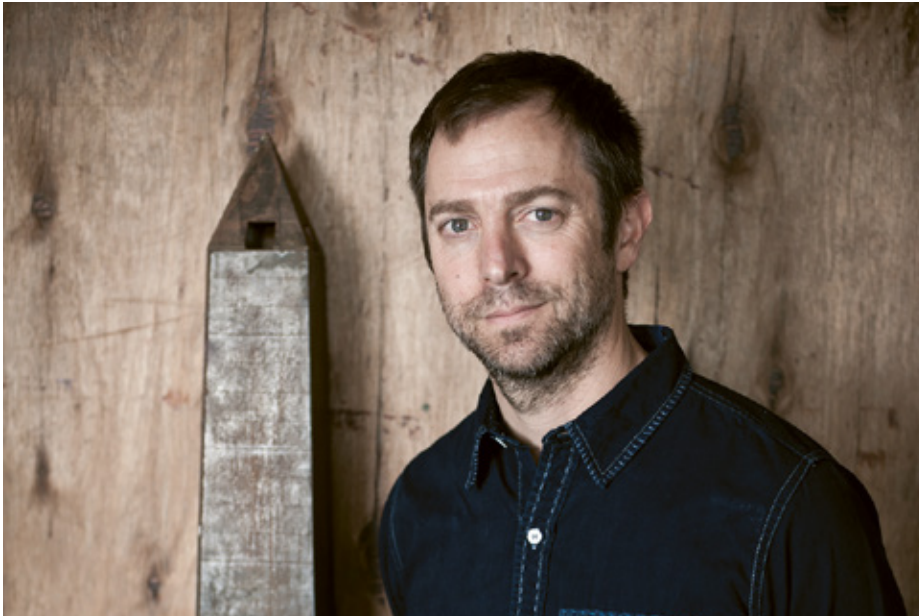
Leandro Erlich.