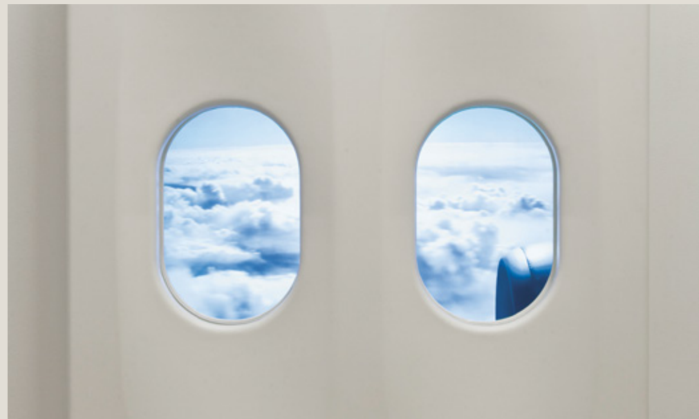
El Avión, 2011