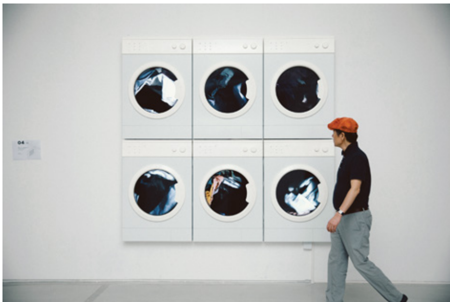
Six Cycles, 2018

El punto de partida suele ser una extrañeza, la sensación de que hay algo fuera de lugar. En algunos casos, ésta se presenta de inmediato (como en Window and Ladder ); en otros, va surgiendo a medida que el público se involucra en la propuesta y descubre perturbaciones o irregularidades (como en Ascensores ). Lo crucial, sin embargo, no es la sensación sino su efecto. No es tan importante identificar su origen o adivinar cómo están contruidas las piezas, sino admitir que nuestros sentidos no son infalibles y que las cosas no siempre son lo que parecen.