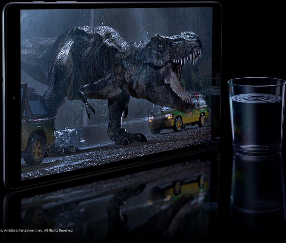
Image simulated.