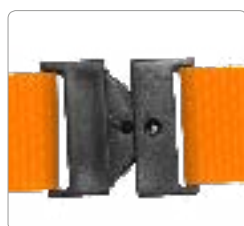
Fermeture de sécurité