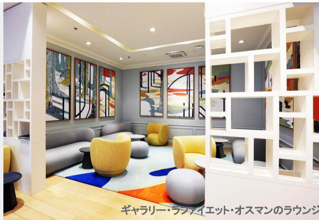
ギャラリー・ラファイエット・オスマンのラウンジ

Accédez au Lounge "Le Concierge" ou dans un espace Services et profitez du remboursement rapide de 12% de la TVA et d'un rafraîchissement si disponible. (2)