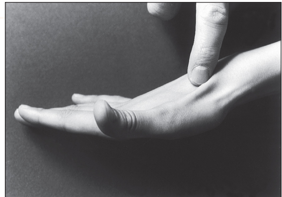
Fig. 15-15. Tendon du muscle long extenseur du pouce au poignet

TA Pour faire apparaître le tendon, on demande au sujet d'amener le pouce en arrière du plan de la main. Ce tendon constitue au poignet la limite postéro-latérale de la tabatière anatomique, la limite antéro-latérale étant constituée par le tendon du muscle court extenseur du pouce.