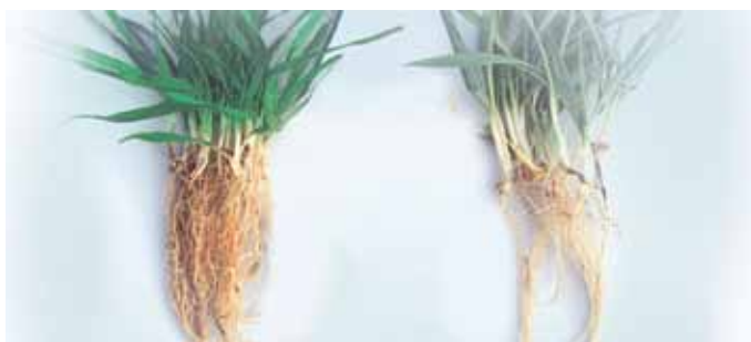
В ляво на пшеница от семена третираны с YaraVita Teprosyn NP+Zn и в дясно от нетретираны семена