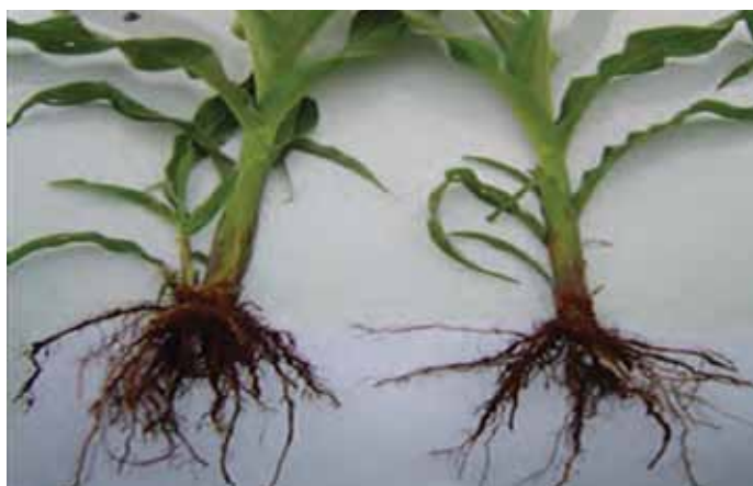
Ляво: растение царевица от семе третирано с YaraVita Teprosyn NP+Zn Дясно: растение от не третирано царевично семе.

Опитите проведени с YaraVita Teprosyn NP+Zn при царевица, показват подобряване на кълняемостта на семената, вкореняването и развитието на растението, което е довело до повишаване на добива.