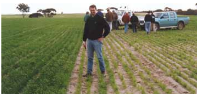
В ляво растения от семена третираны с YaraVita Teprosyn NP+Zn и в дясно растения от нетретираны семена.

Опитите проведени с YaraVita Teprosyn NP+Zn при царевица, показват подобряване на кълняемостта на семената, вкореняването и развитието на растението, което е довело до повишаване на добива.