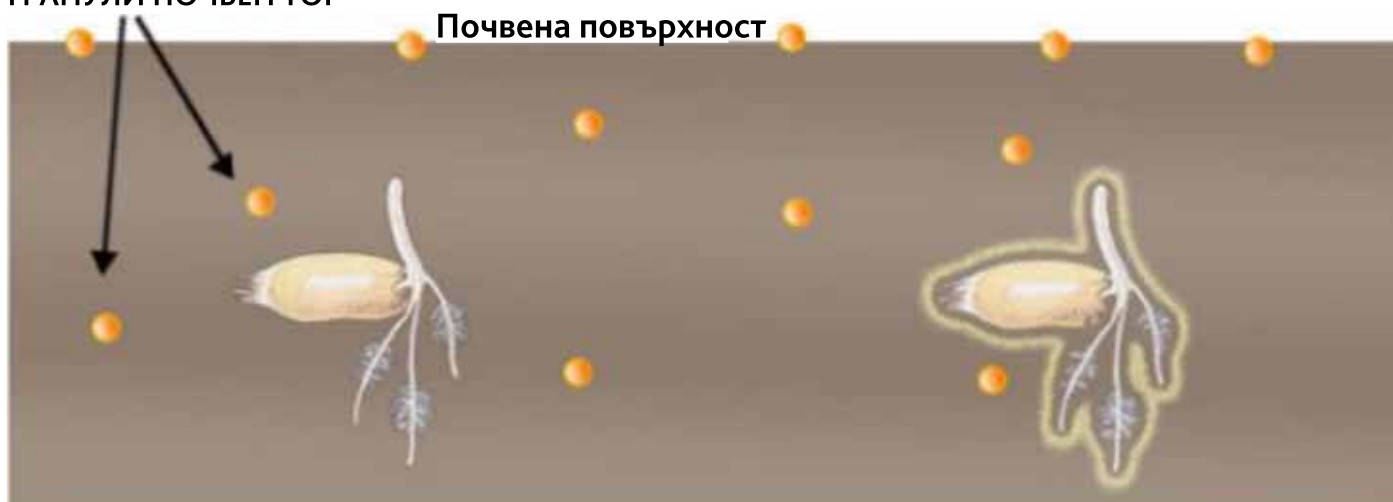
В дясно семената третираны с YaraVita Teprosyn NP+Zn имат незабавен достъп до хранителните вещества в почвата.