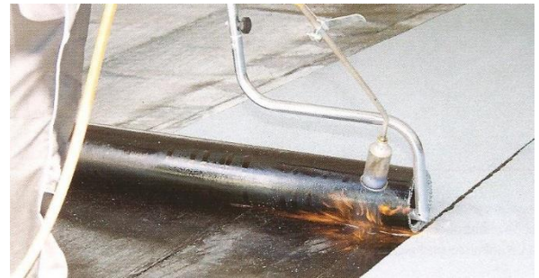
Variantní natavování rozbalovačem rolí