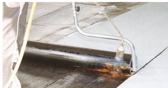
Variantsní natavování rozbalovačem rolí