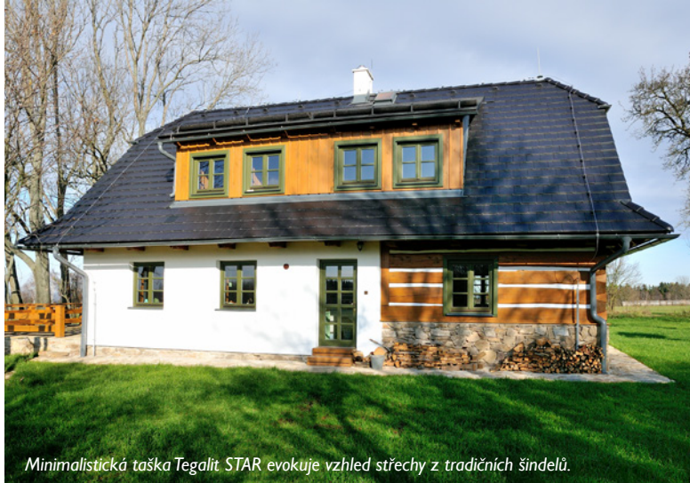
Minimalistická taška Tegalit STAR evokuje vzhled střechy z tradičních šindelů.