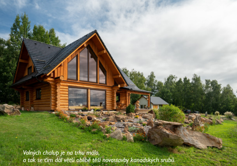
Volných chalup je na trhu málo, a tak se čím dál větší oblibě těší novostavby kanadských srubů.