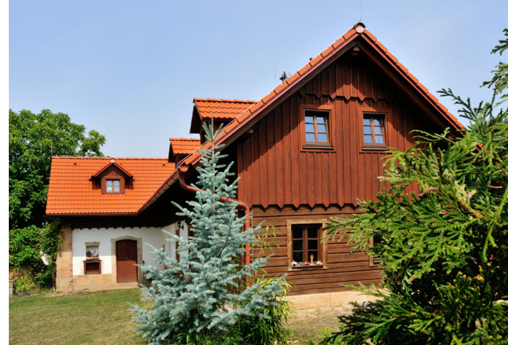
Pokud máte tradiční zděnou chalupu, možná dáte přednost klasickému tvaru střešní tašky se zvlněným profilem.

Řada chalup je postavená uprostřed přírody a v průběhu své životnosti musí čelit vyšším teplotním výkyvům a leckdy velmi nepříznivým povětrnostním vlivům. Všechny betonové tašky z portfolia značky BMI BRAMAC disponují komplexním systémem originálních střešních doplňků a příslušenství, které zajišťují spolehlivou ochranu proti větru, dešti, sněhovým srážkám nebo úderům blesku. Jednotlivé systémové komponenty do sebe optimálně zapadají a dohromady vytvářejí Inteligentní střešní systém BMI BRAMAC. Jde o prověřené řešení střešního pláště, na které se vztahují nadstandardní záruky. Výrobce nabízí 30letou záruku na kvalitu všech nabízených typů krytin. Dle vybraného příslušenství pak mohou zákazníci získat i 10letou nebo 15letou záruku na funkčnost střešního systému.