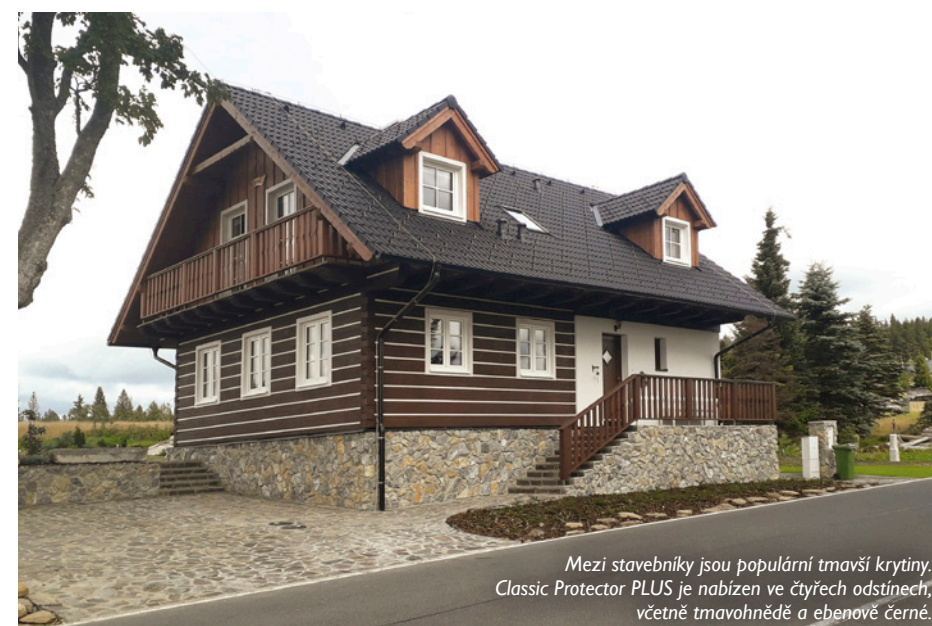
Mezi stavebníky jsou populární tmavší krytiny. Classic Protector PLUS je nabízen ve čtyřech odstínech, včetně tmavohnědé a ebenové černé.