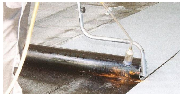
Variantní natavování rozbalovačem rolí