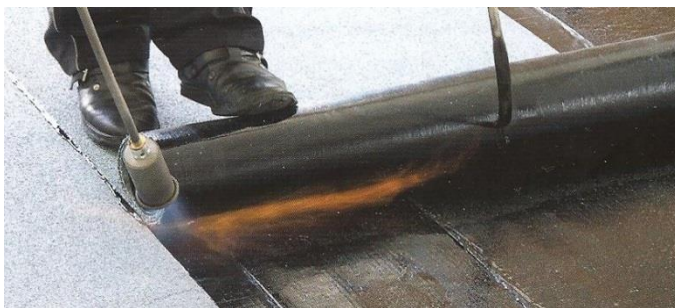
Natavování s navíječem rolí rozbalovačem rolí