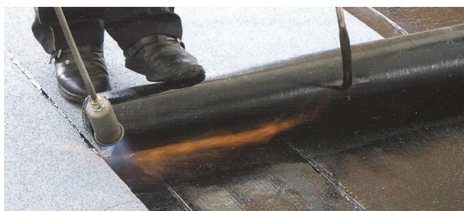
Natavování s navíječem rolí rozbalovačem rolí