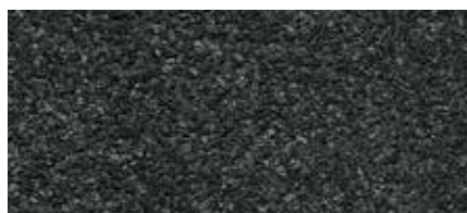
30 Tmavě šedá (minerální břidlice)