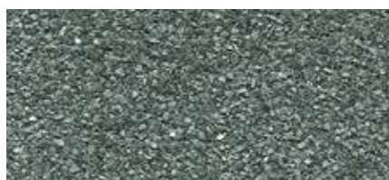
1 Světle šedá (minerální břidlice)