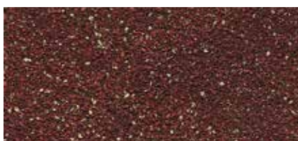
45 Cihlově červená (ker. granulát)