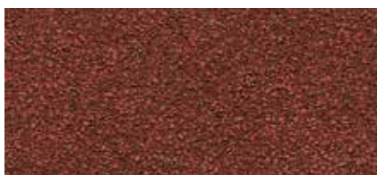
52 Bauxitově červená (ker. granulát)

Všechny vrchní posypy asfaltových pásů výrobního závodu BMI Siplast, Francie, jsou hydrofobizované (nenasákavé).