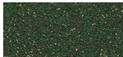
64 Světle zelená (keramický granulát)