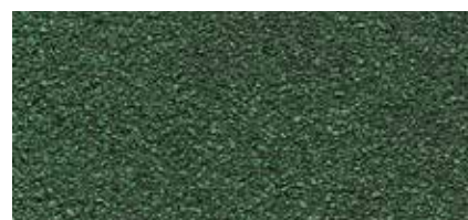
53 Malachitově zelená (ker. granulát)