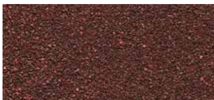
46 Hnědá (keramický granulát)